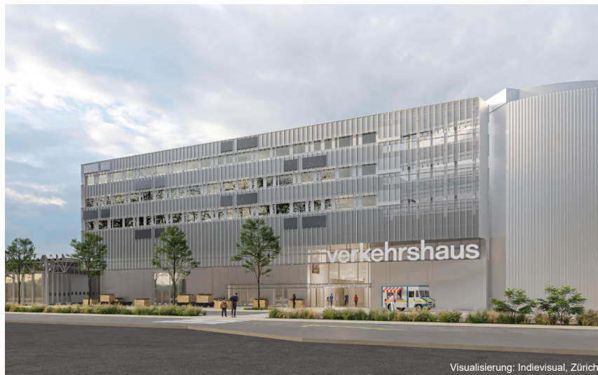
Visualisierung: Indievisual, Zürich

Disclaimer: Als TeilnehmerIn erklären Sie sich damit einverstanden, dass im Rahmen der Veranstaltung Bilder und/oder Videos von den Teilnehmenden gemacht werden und zur Veröffentlichung in digitalen und gedruckten Medien des SIA Zentralschweiz verwendet werden. Die Fotos und/oder Videos dienen ausschliesslich der Öffentlichkeitsarbeit des SIA Zentralschweiz.