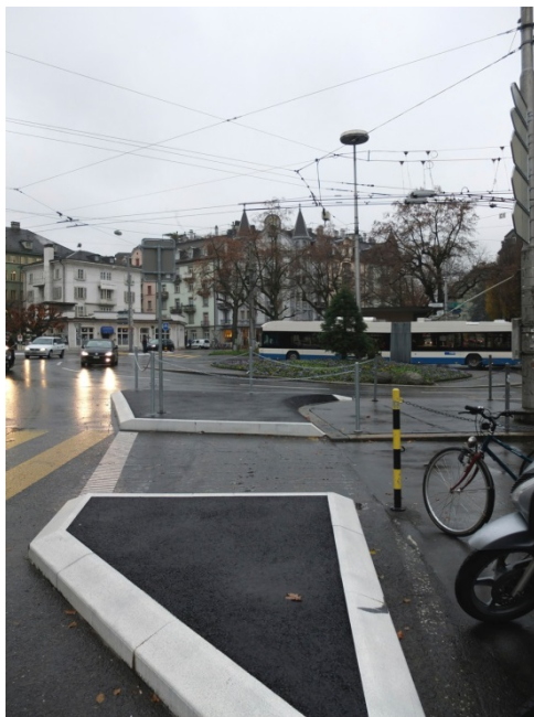
gestalterisch schlechte Lösungen beim Bundesplatz