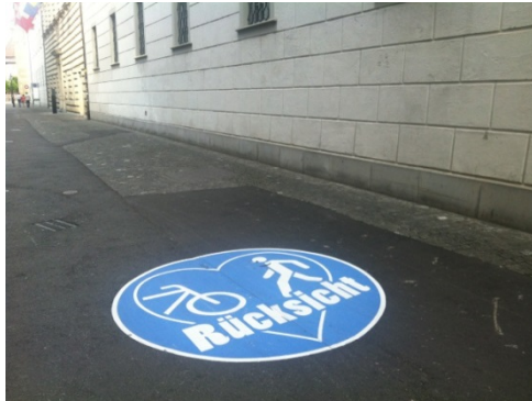
gestalterisch unsensible Markierungen in der Altstadt