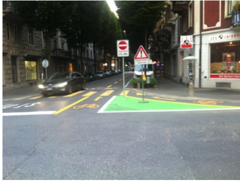
gestalterisch misslungene Signalisation im Bruchquartier