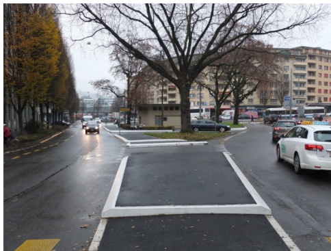
gestalterisch anspruchslose Inseln beim Bundesplatz